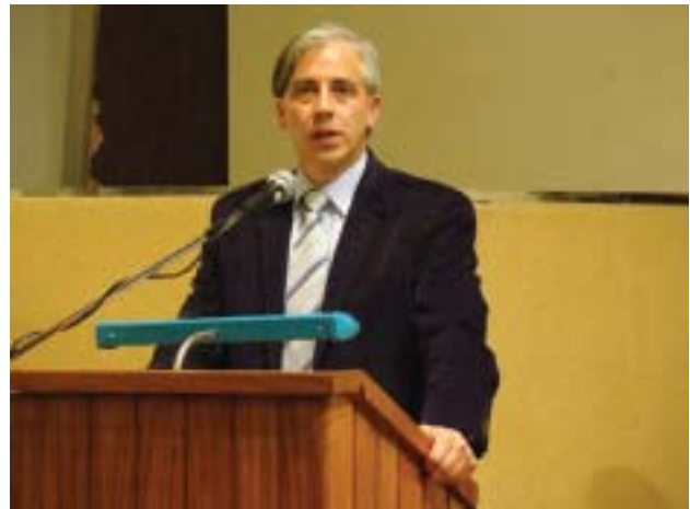
Álvaro García Linera Vicepresidente del Estado Plurinacional de Bolivia

“... Aún no ha concluido el proceso constituyente, tenemos un Estado en transición...” asevera el Vicepresidente Álvaro García Linera, expositor del Seminario internacional Bolivia post-constituyente: Tierra, territorio y autonomías indígenas. Su presentación, dividida en dos partes, aporta una visión histórica, cíclica y de largo plazo; primero, a través de una mirada sobre la Bolivia post-constituyente como un “proceso constituyente” que aún no concluye; y segundo, al referirse a la arquitectura fundamental para este nuevo escenario constituyente.