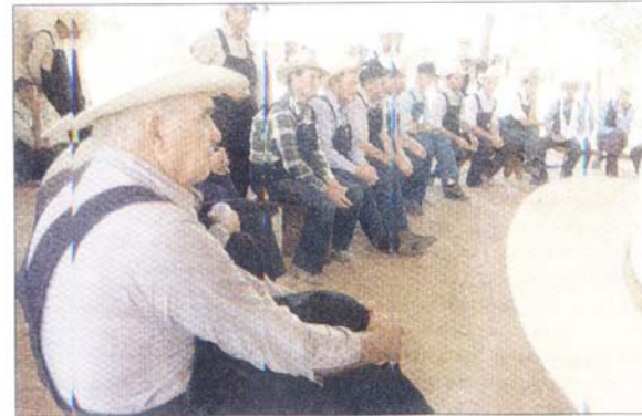
NO VIEN ALTERNATIVAS • Los menonitas se reunieron para ver qué pueden hacer. Quieren reprogramar sus créditos.

"Tengo una deuda desde 2001 y la estoy pagando con mi ganado y mi maquinaria nueva. La sequía es incontrolable. El año pasado resultó mejor para los que sembraron temprano. La recomendación de Anapo era que la época de siembra se haga más temprano, después nos dijeron que los períodos de sequía ocurrían en enero. Al final todos los años es diferente".