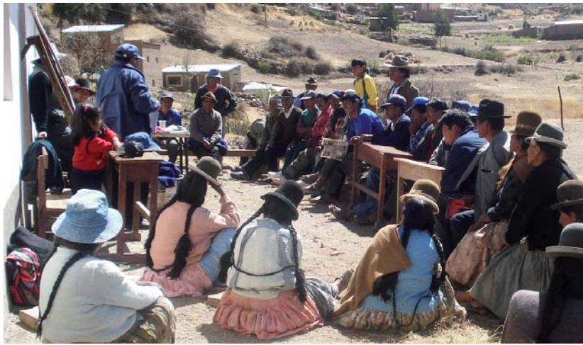
En comunidad: En el área rural aplicarán la justicia de acuerdo con sus normas y procedimientos propios.

La Ley del Órgano Judicial reconoce la coexistencia de varios sistemas jurídicos, principalmente de la justicia de las naciones y pueblos indígena originario campesinos. La plurinacionalidad y el pluralismo jurídico son dos principios fundamentales inscritos en esta nueva Ley.