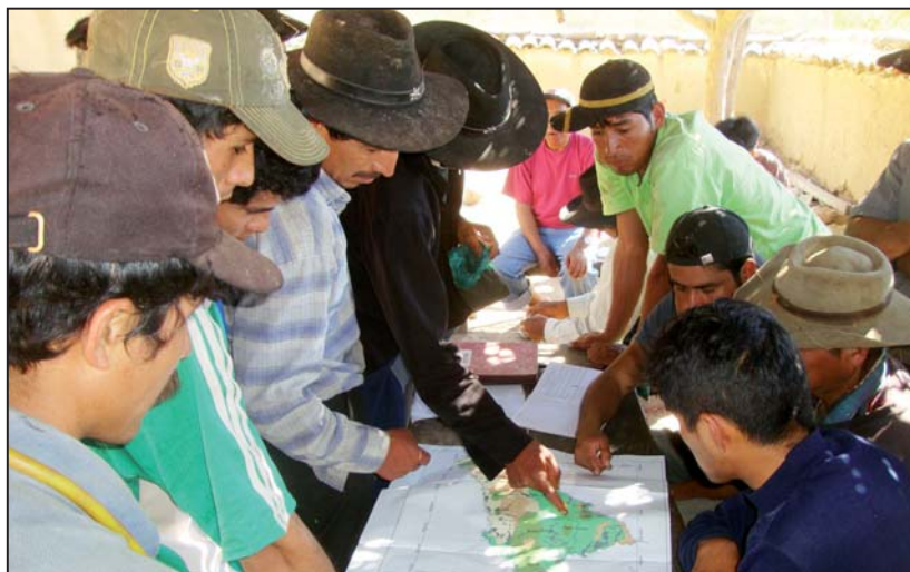
Trabajo de campo: Los comunarios verifican en los mapas el terreno que luego identificarán.