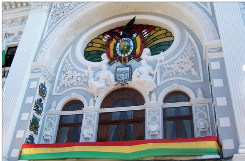
Asamblea Constituyente: en Sucre (2006) nació la Constitución que incluye los gobiernos subnacionales