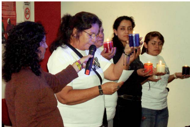
Ceremonia: El colectivo Marcha de Mujeres Campesinas bendice el encuentro internacional.

► Reunión: en julio presentaron sus experiencias 65 representantes de diez países de Sudamérica