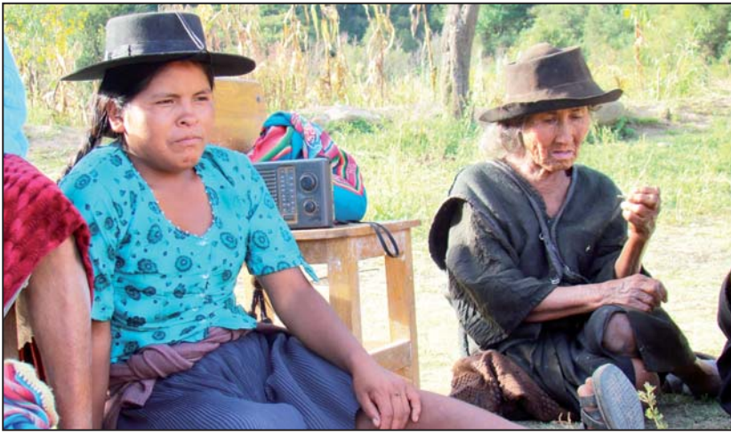
Decisiones: La elección de autoridades podría realizarse en asambleas o cabildos públicos.

La Ley del Régimen Electoral tiene como finalidad ejercer la democracia intercultural desde un sistema electoral basado en el reconocimiento de la existencia de distintos tipos de democracia: participativa, representativa y además la comunitaria.