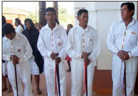
Cabildo indígena: Autoridades recibieron a los visitantes

San Ignacio de Velasco, en Santa Cruz, celebró 262 años de fundación y su fiesta patronal en homenaje a San Ignacio de Loyola el 31 de julio. Las autoridades y representantes