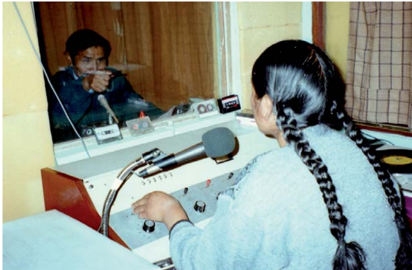
En vivo: Locutores de radio Santa Clara del municipio de Sorata, Provincia Larecaja de La Paz, durante la transmisión radial

Según datos no oficiales, en el altiplano se han conformado tres redes de radios aymaras comunitarias: Red de radios y TV comunitarias, Asociación Provincial de Radios Comunitarias (APRAC) y Asociación de Radio Emisoras Aymaras de La Paz, alrededor de 100 emisoras se distribuyen en estas estas redes.