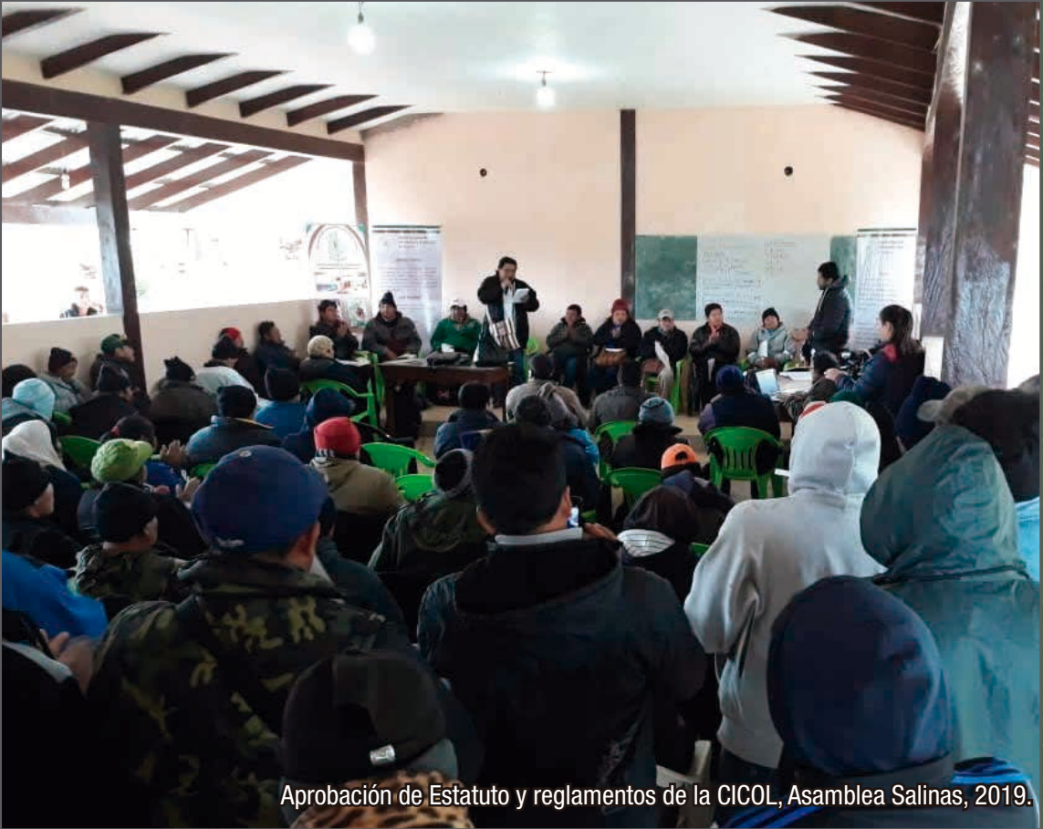
Aprobación de Estatuto y reglamentos de la CICOL, Asamblea Salinas, 2019.

Esta publicación es posible gracias al apoyo de: